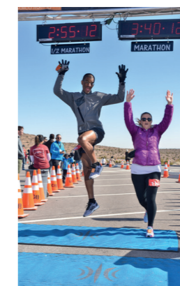
Elibus des apist, que poris sam sin cusapienihit que porro velicid quibus estrum dolore eos il et quidionse natium fugias rerum quam quunt perum

démarré très fort dans le championnat américain. Les habitants sont à fond derrière elle et le port du tee-shirt avec le désormais célèbre casque de viking est devenu quasi indispensable. Même la mini-statue de la Liberté de la ville a le sien ! On le sait peu, mais la région offre surtout un superbe terrain de jeu pour les coureurs, sur route ou en trail. Bien sûr, le marathon de Las Vegas est un incontournable aux USA, avec un parcours ultra roulant, un feu d'artifice au départ, une médaille énorme à l'arrivée, quelques coureurs déguisés en Elvis et, surtout, la possibilité de se marier sur le parcours grâce à un pasteur qui, tous les ans, prend le départ au milieu de ses ouailles pour les bénir au 12e km, coupe de champagne à la main, avant de repartir à la conquête de la ligne d'arrivée. Attention, le mariage ainsi réalisé est on ne peut plus légal ! Nous avons, de notre côté, testé pour vous le Red