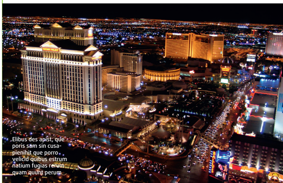
Elibus des apist, que poris sam sin cusapienihit que porro velicid quibus estrum natium fugias rerum quam quunt perum

références françaises, le but des hôtels étant avant tout de vous garder le plus longtemps possible sur place pour que vous dépensiez. Sachez que les petits déjeuners ne sont jamais inclus et qu'il faudra en tenir compte dans le budget. Notre coup de cœur va au Park MGM, qui est parfaitement situé sur le strip, légèrement en retrait et face à la fameuse patinoire de l'équipe des Golden Knights. Avantage : le casino se situe à l'arrière de l'hôtel et non devant la réception, ce qui évite de le traverser à chaque fois, parce qu'on le sait peu, mais ce sont les dernières zones « fumeurs » aux USA. À proximité, on trouve de nombreux restaurants dont le nouveau Eataly, qui permet une pasta