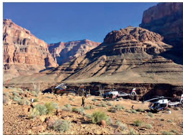
La vie en Grand (Canyon)