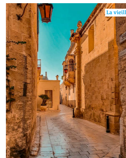
La vieille ville de Mdina.