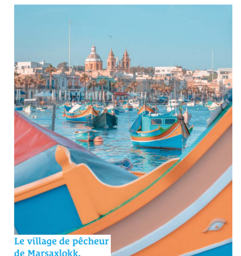
Le village de pêcheur de Marsaxlokk.